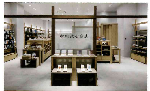
中川政七商店 アミュプラザおおいた店